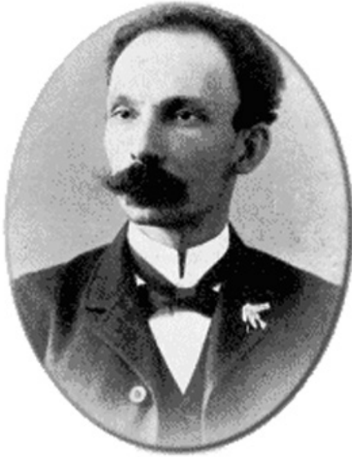
José Martí (1853 - 1895)

Küba'nın İspanya'ya karşı verdiği bağımsızlık savaşının sembolü olmuş şair, deneme yazarı, eleştirmen, hatip ve gazeteci José Julián Martí y Pérez 28 Ocak 1853'de Havana'da doğdu. Babası bir topçu çavuşuydu. İlk eğitimini Havana'da gördü. 15 yaşındayken şiirlerini yayımlamaya başladı. 16 yaşında La Patria Libre (Özgür Vatan) adlı bir gazete çıkardı. 1868'de başlayıp yaklaşık on yıl kadar sürecek olan İspanya'ya karşı bağımsızlık savaşına katıldığı için henüz 17 yaşındayken tutuklandı. Altı ay süren kürek cezasından sonra, 1871'de İspanya'ya sürüldü. İspanya'da öğrenimine devam eden José Martí, Madrid ve Zaragoza üniversitelerinde hukuk, felsefe ve filoloji öğrenimi gördü.